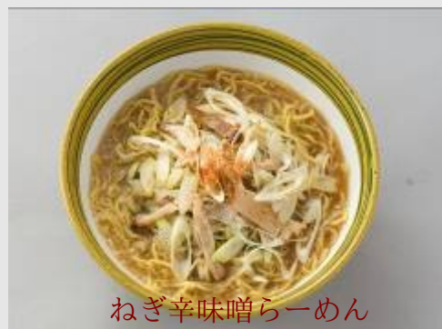
ねぎ辛味噌らーめん