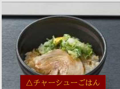
△チャーシューごはん