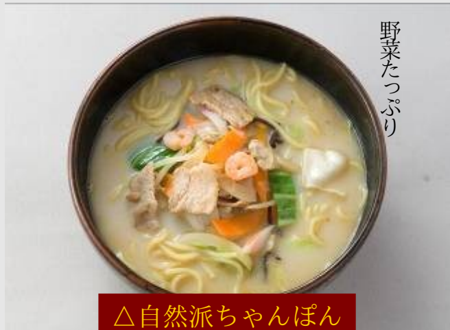
△自然派ちゃんぽん