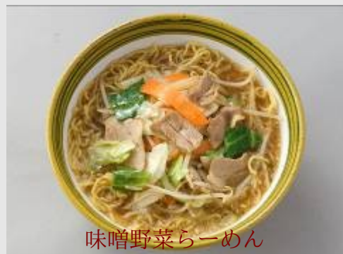
味噌野菜らーめん